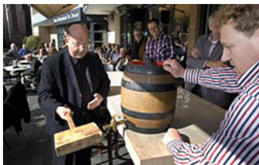
“Salland Landbier Brouwerij”

Het huidige Leaderprogramma loopt af. Met ons krachtige netwerk als fundament staan we op scherp voor de volgende fase: Leader 3. Op naar 2020!