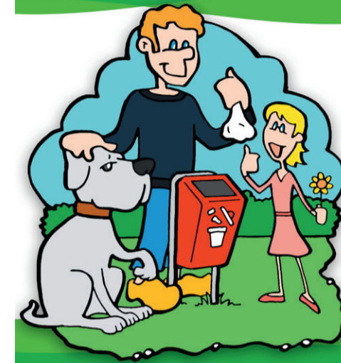
Hondenpoep in een zak in de bak

In 'Van de gemeenteraad' plaatsen we informatie van en over de gemeenteraad. Wat doet de gemeenteraad nu precies en hoe worden besluiten genomen? Hoe heb je als inwoner daar invloed op? Hoe bereidt een raadslid zich voor op het nemen van een besluit?