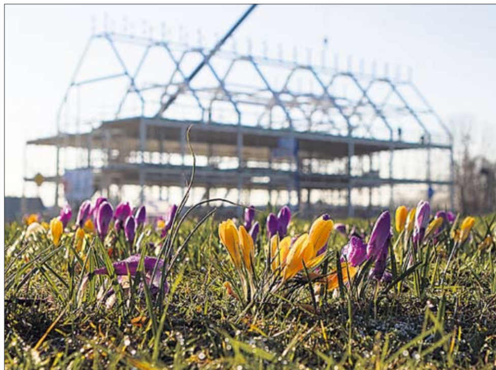
Bij de start van de lente zijn de contouren van het gemeentehuis zichtbaar.

Met Gedeputeerde Staten is ook overeenstemming bereikt over de aanleg van een rotonde in de kruising van de Rijksstraatweg en de Raalterweg. Door deze maatregelen verwachten we dat het oostelijk deel van de Raalterweg (van spoor naar de