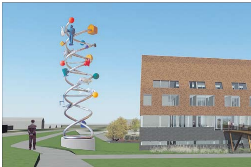
Kunstwerk op de hoek Rijksstraatweg/Raalterweg.

rotonde bij Boerhaar) geen aanpassing nodig heeft.