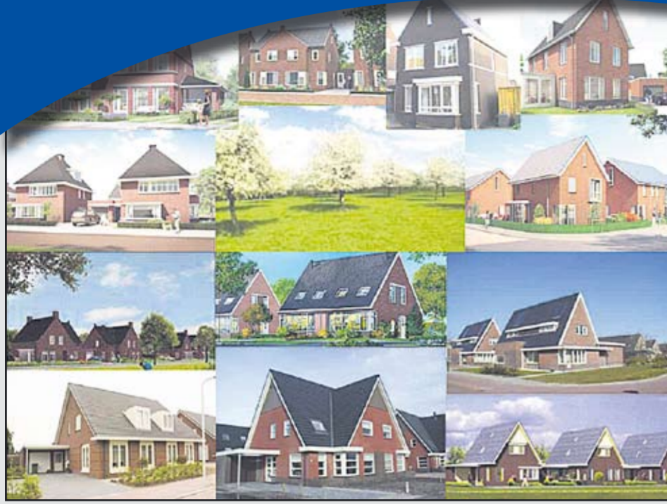
Enkele voorbeelden uit het beeldkwaliteitsplan