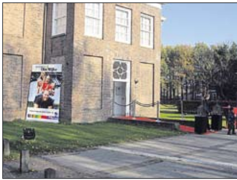
wordt op woensdag 16 november bekend gemaakt

Ook maakten de bezoekers kans op een dinercheque ter waarde van € 200, - die te besteden is bij één van de vele eetgelegenheden in de gemeente. De winnaar van de dinercheque